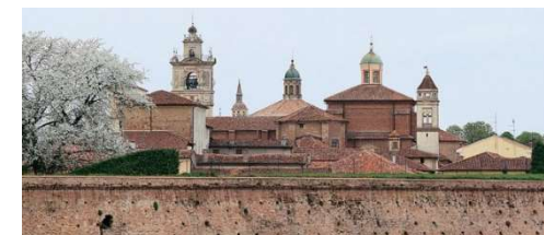
Sabbioneta - profilo della città