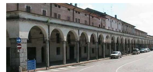
Gazzuolo - Portici gonzagheschi